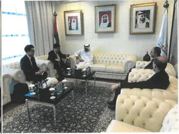
자이드 대학교 두바이 분교