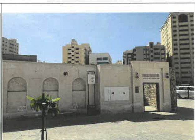
샤르자 예술 재단