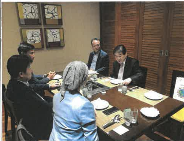
두바이 한인회 및 한인상공인협의회 간담회