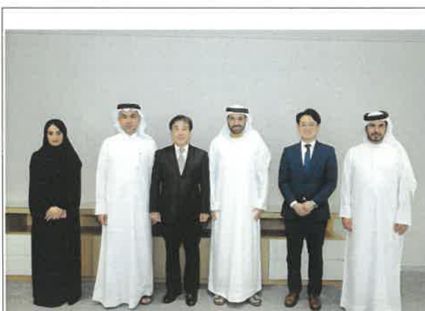
두바이 문화 재단